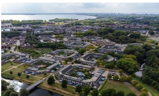
DE SCHOOL-, STADS- EN ROZENWERF