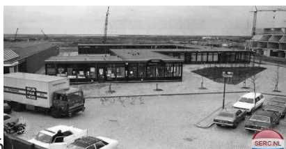
DE BRINK 1976